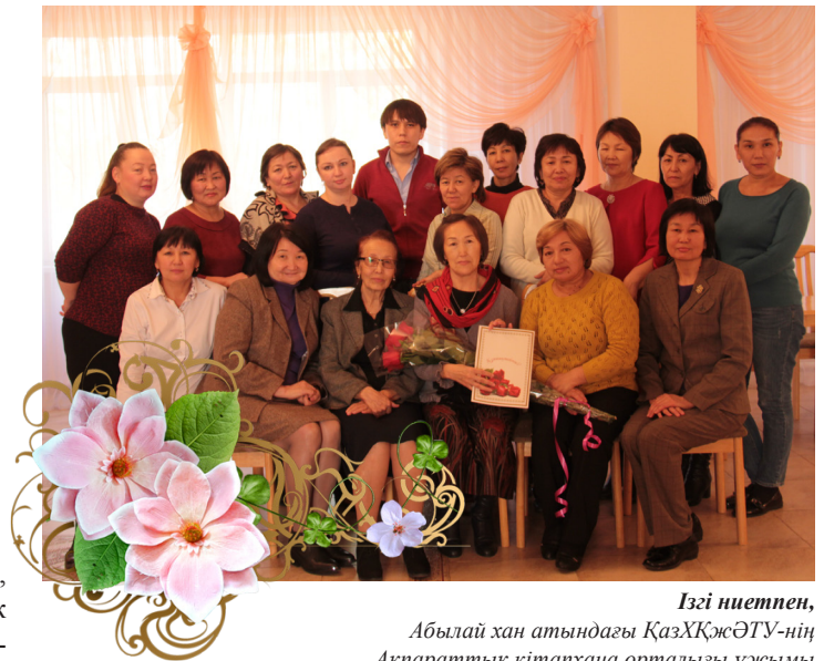
Ізгі ниетпен, Абылай хан атындағы ҚазХҚЖӘТУ-нің Ақпараттық кітапхана орталығы ұжымы

Отанда, туған-туысқандардың ортасында балқыған бақытқа толсын! Өмір жолыңыз ұзақ болып, көрген бейнетіңіздің зейнеті 100 есе, 1000 есе болып денсаулық, бақыт, байлық алып келсін! Жапырағын жайған мәуелі бәйтеректей ғұмыр тілейміз! Құрметті демалысыңыз 100 жасқа дейін ұлассын!