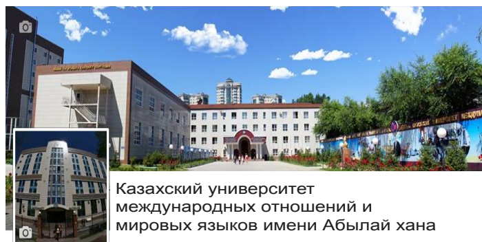
Казахский университет международных отношений и мировых языков имени Абылай хана